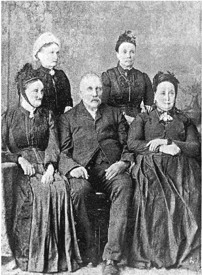
'n Seldsame foto van president M. W. Pretorius en sy eggenote (sittende links voor). Een van die ander drie dames was 'n sus'er van die President; die name van die ander twee is nie bekend nie.