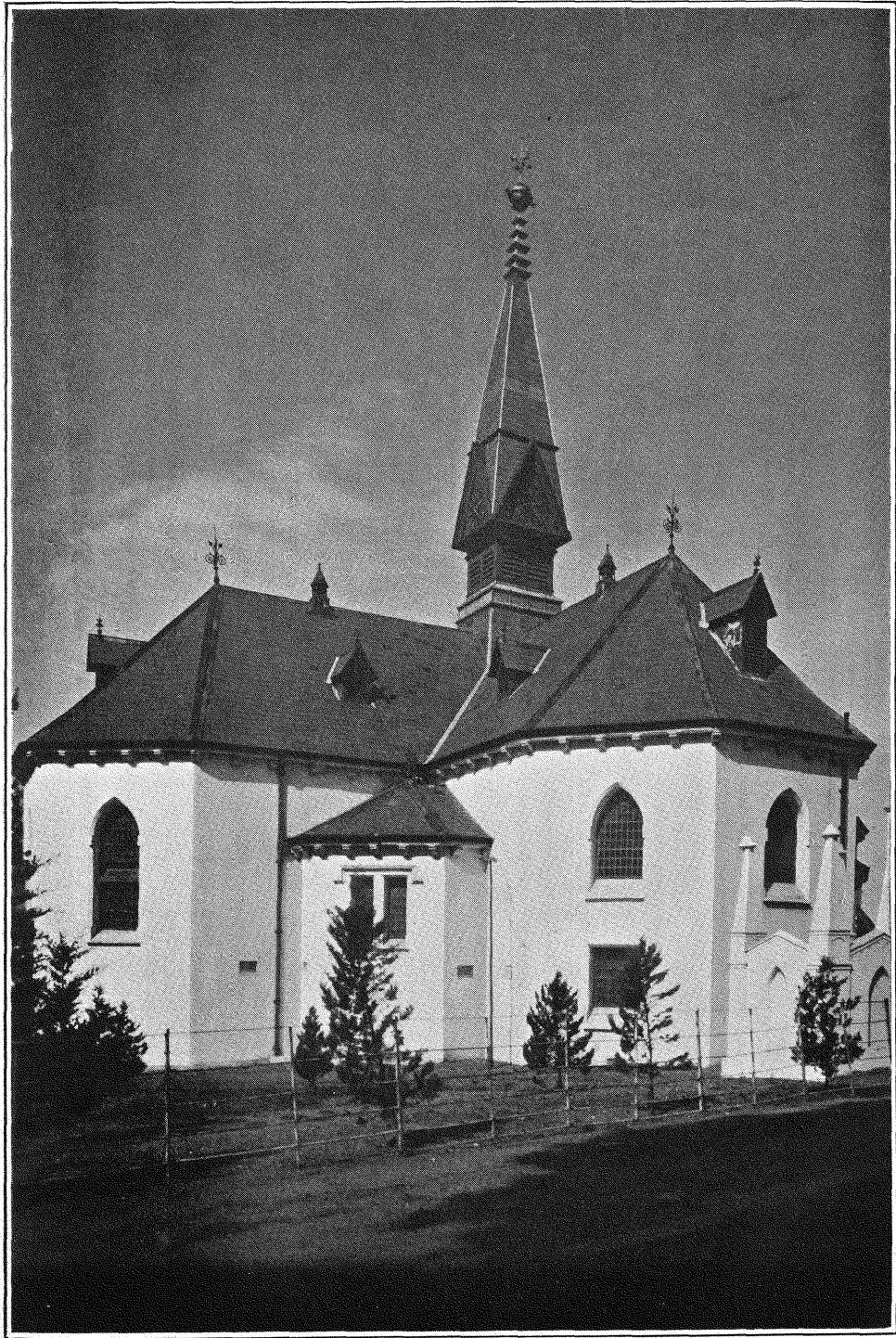
DIE HOOFKERK, WYNBERG.