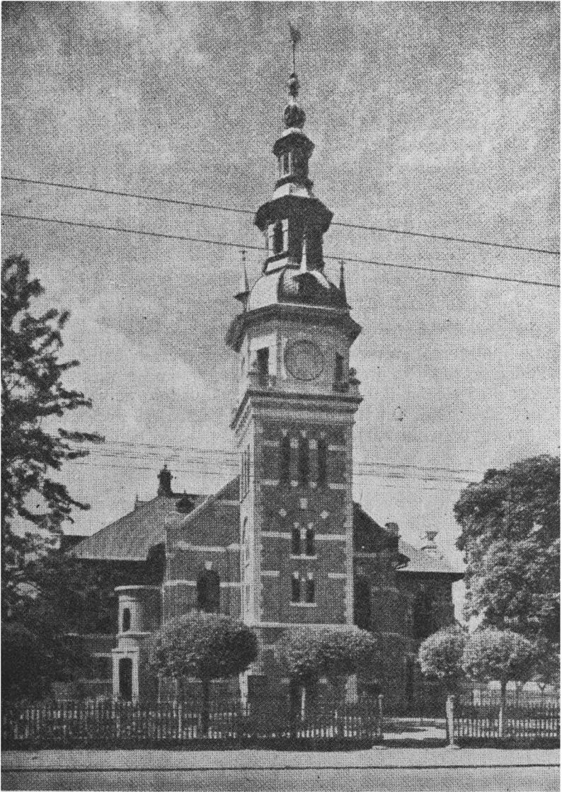
Die kerkgebou van die Gereformeerde Gemeente van Pretoria in Kerkstraat- Wes, ontwerp deur Klaas van Rysse en opgerig in 1896.