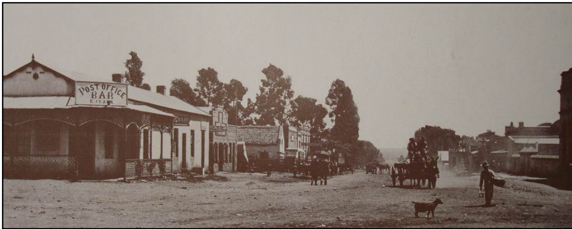
Noord-westelike hoek van Kerkplein en Kerkstraat ca. 1888 [Dun-01 p163]

Wat is 'n brief nou sonder 'n foto. Ek het op die oomblik 10 foto's van daardie hoek en dit was vreeslik moeilik om te besluit watter foto's om te gebruik. Ongelukkig moes ek die foto's baie klein maak en dus is die kwaliteit nie baie goed nie.